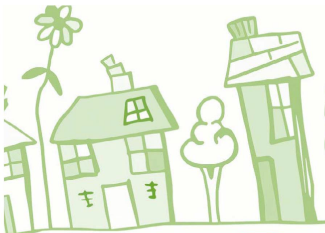
Table de concertation logement HR